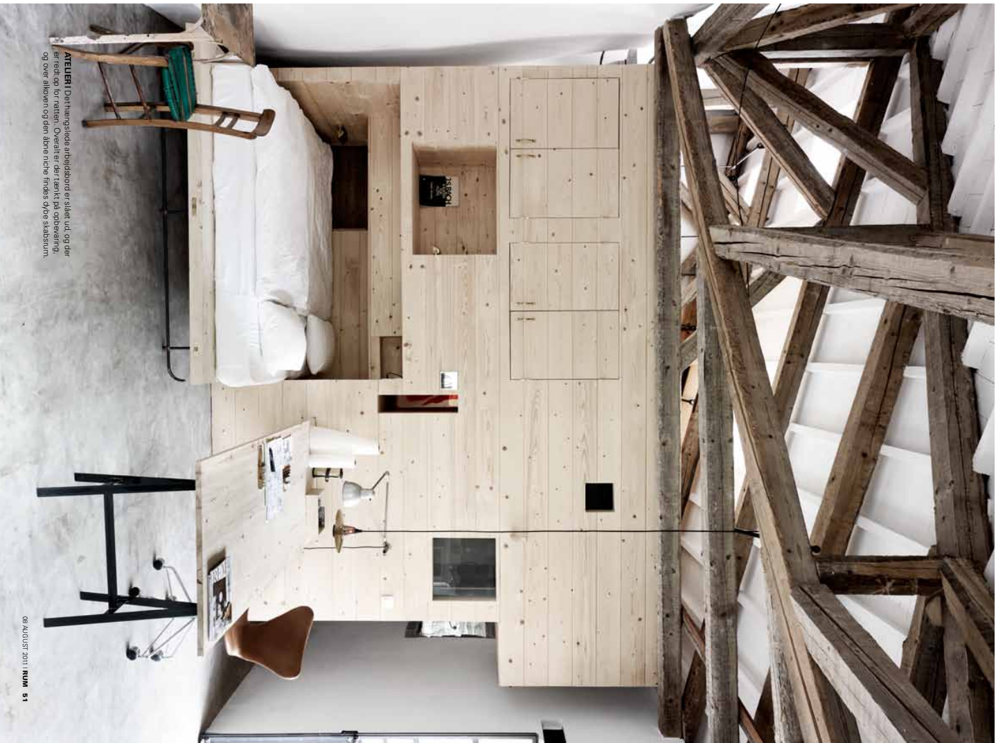
ATELIER! Det herregædte arbejdsbord er sikret ud, og der er redskab for næsten. Ovenalt er den tænkt på opsætning, og oven arbejden og den åbne niche findes dybe skabsrum.