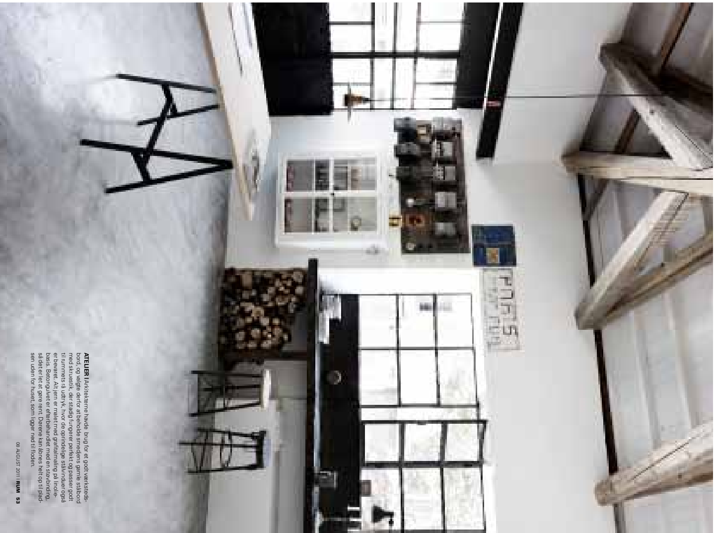
ATELIER I Lækkere havde brug for et godt værktøjsbord, og vilge derfor at beholde smøgens gamle stæbord med skruestik, der stadig fungerer perfekt og passer godt til rummets rå udtryk, hvor de oprindelige stælvinduer også er bevaret. Alt frem er malet med grålakmaling på linoleumbasis. Beskrivelsen er et billede med en størrelsesforhold, så det er et godt billede. Døren kan åbnes helt op til pladsen uden for huset, som ligger ned til jorden.