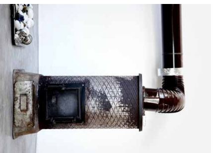
DEKALKE I Den gamle brændovn fra 50'erne varmer effektivt alle tre op i vintermånederne.