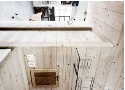
BAD I I gangen mellem de to rum er der en ind til det lille badeværelse, der også er bygget ind i kassen.