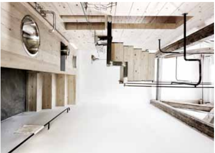
KØKKEN I Trappen har et frørdigt forløb, så man lige nå børstede køkkenborden for at kigge op til søvnløserne oven på. Ledningssumstuerne over den under lækker vist er TONL.