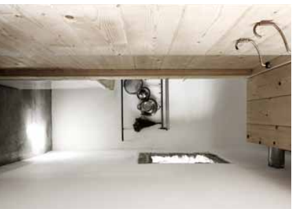
KØKKEN I I Et lille fritkøkken vindes slipper i vs ind til køkkenet, der er indrettet bag kassen.