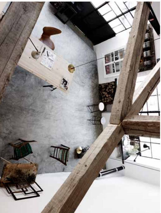
ATELIER! Fra de øverste køjer oppe under taget er der et fint bly til det store værkstedsrum.

Tidligere smedje, som er blevet restaureret. Beliggende i byen Plomari på den græske ø Lesbos.