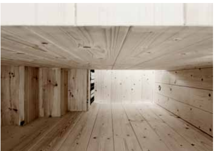
TRAPPE I Gennem hjoksen går en smul passage og trappe, som fører op til de øverste sovepladser.